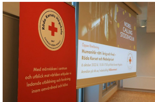
Bild från den öppna föreläsningen Nobel Calling Stockholm på högskolan.

Nobel Calling Stockholm är en serie öppna evenemang med vetenskapsanknytning som hålls den vecka i oktober när årets Nobelpris tillkännages. Röda Korsets Högskola arrangerade i samarbete med Nobel Prize Museum en öppen föreläsning på temat "humanitär rätt i krig och fred, Röda Korset och skyddet för frihetsberövade personer". Röda Korsets arbete har belönats med Nobels fredspris fyra gånger: tre genom organisationen och ett genom dess grundare.