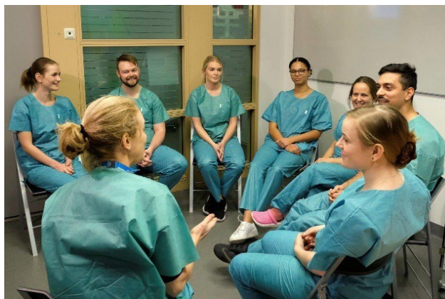
Studenter på Kliniskt Träningscentrum (KTC)

Högskolan beslutade därför att inte anta några nya studenter till utbildningen HT 2022, utan utökade i stället antalet platser på de andra två inriktningarna. Vi planerar programstart för den nya utbildningen HT 2023.