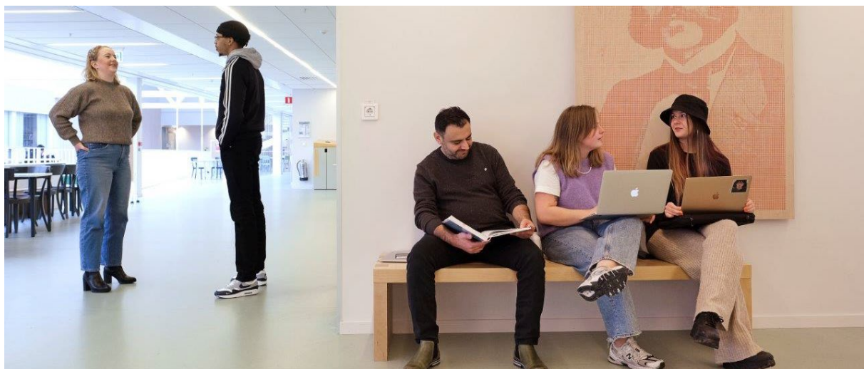
Studenter vid Röd Korsets Högskola.