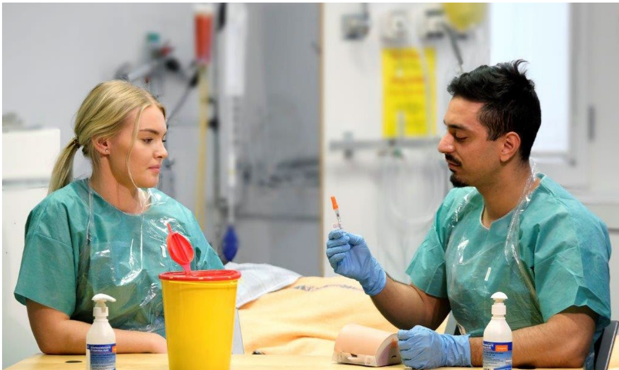
Studenter vid Röda Korsets Högskola på Kliniskt Träningscentrum (KTC).