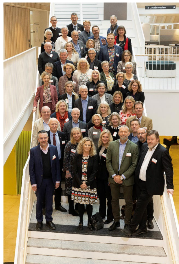
Rektorer, universitets- och högskoledirektörer/förvaltningschefer från de lärosäten som medverkade i SUHF:s förbundsårsamling.

Dagen efter höll SUHF sin förbundsårsamling på vår högskola. Förbundsårsamlingen är SUHF:s högsta beslutande organ och lärosätena företrädts av rektorer och universitets- och högskoledirektörer/förvaltningschefer.