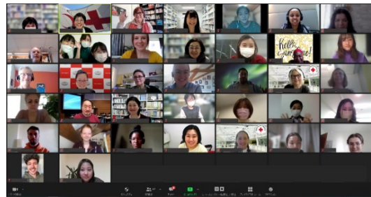
Virtuellt utbyte mellan studenter i Sverige, Schweiz och Japan.

Högskolan har också inlett ett samarbete med Bertil Edlunds Stiftelse kring medel som stödjer internationellt utbyte för högskolans studenter. Röd Korsets Högskola får medel för att stötta studenter som genomför utlandsstudier vid något av de lärosäten som högskolan samarbetar med. Stiftelsen ger också stöd till utvecklingsinsatser för högskolans internationaliseringsarbete.