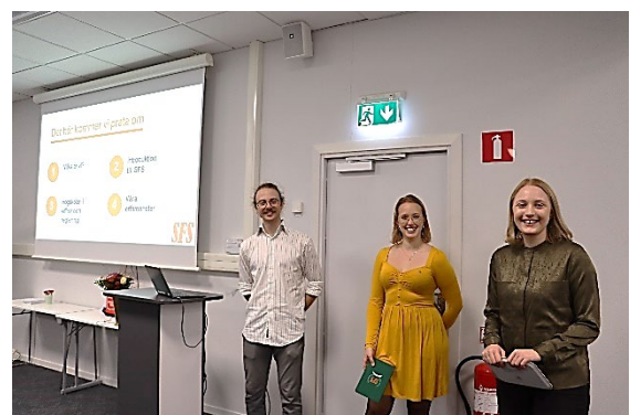
Representanter från Sveriges förenade studentkårer (SFS).

I oktober arrangerade vi, tillsammans med Vård- och omsorgscollege (VOC), "Vård- och omsorgscollegedagen" på Röda Korsets Högskola och KTH. Det var en heldag där avgångselever i gymnasieskolan fick möjlighet att inspireras och lära sig mer om utbildning och yrken inom vård och omsorg. Hundratals elever kom till högskolan för presentationer och monterutställning. VOC Stockholm erbjuder utbildning inom vård och omsorg genom att samla högskoleförberedande vård- och omsorgsprogram på gymnasienivå, vård- och omsorgsutbildning på Komvux och specialistutbildningar för undersköterskor på yrkehögskolenivå. I samarbetet inom VOCdagen ingår Region Stockholm, Stockholms stad, Solna stad, Haninge kommun, Botkyrka kommun, Sigtuna kommun, Röda Korsets Högskola, Kungliga tekniska högskolan, Stockholms universitet, Södertörns högskola, fackförbundet Kommunal och Arbetsförmedlingen.