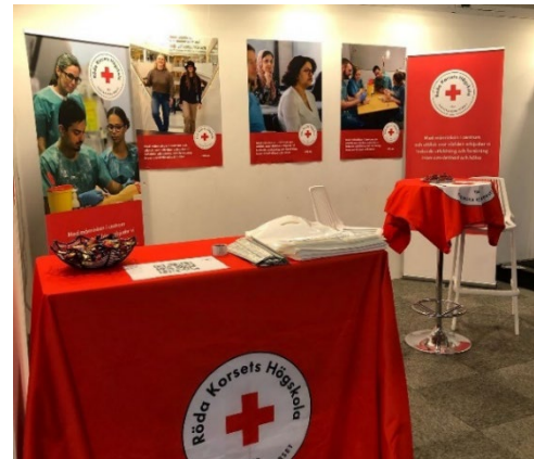
Högskolans monter på Sacomässan.

Från den 1 januari 2022 har Röd Korsets Högskola en ny logotyp. Högskolans nya logotyp har tagits fram i samarbete med Svenska Röd Korsset. Vi har bytt logotyp för att följa nationella och internationella riktlinjer för användningen av det röda korsset eftersom det enligt lag är ett skyddsemlen.