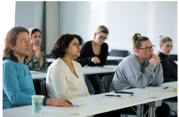
Studenter vid Röda Korsets Högskola.