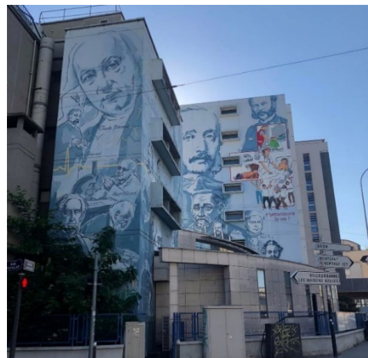
Franska Röd Korsets sjuksköterskeskola Institute Régional de Formations Sanitaire et Sociale Rhône-Alpes , Croix-Rouge Française i Lyon i södra Frankrike.