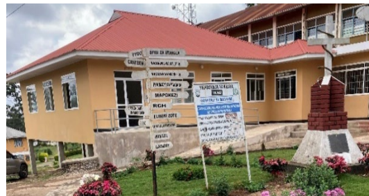
Machame Lutheran Hospital i Tanzania

Röda Korsets Högskola har under året haft avtal med följande lärosäten och sjukhus: