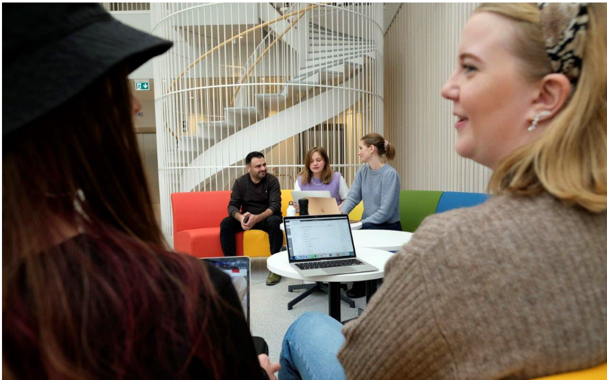
Studenter vid Röda Korsets Högskola

Vi har som ett av de första lärosätena påbörjat implementering av ett utbildningsplaneringsverktyg i den nationella digitala studieadministrativa plattformen Ladok. Detta systemstöd kommer att möjliggöra en kvalitetssäkrad process för utbildningsplanering samt en mer systematisk hantering av utbildnings- och kursplaner.