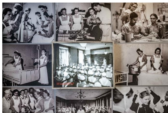
Högskolans utställning om Röd Korsets sjuksköterskeutbildning.