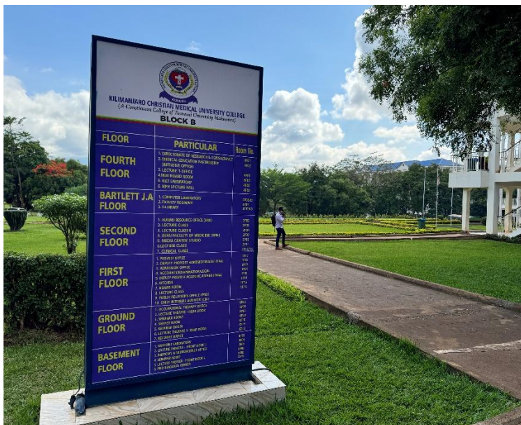
Kilimanjaro Christian Medical University College

Under året har det SIDA-finansierade Minor Fields Study-programmet återupptagits och högskolan har beviljat fyra stipendier för studenter att göra examensarbete i biståndsländer.