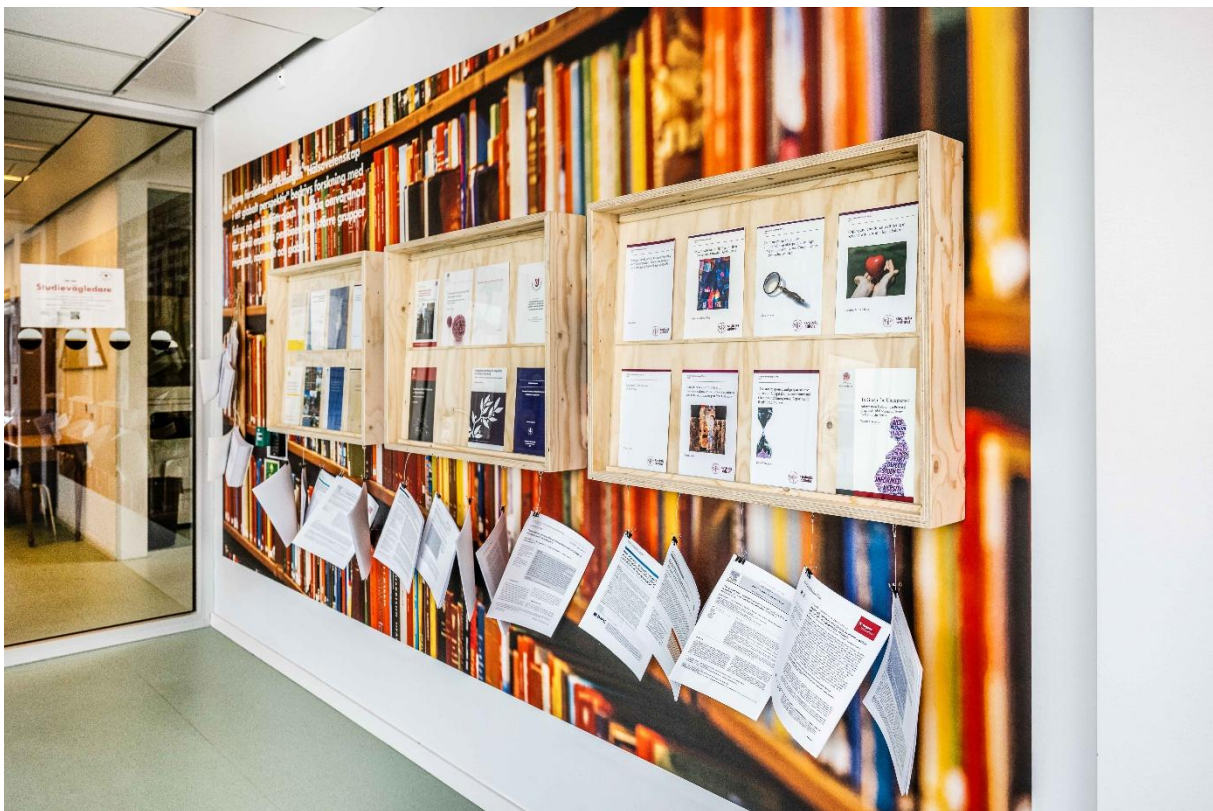
Högskolans forskningsvägg som presenterar medarbetares avhandlingar och forskningsartiklar.