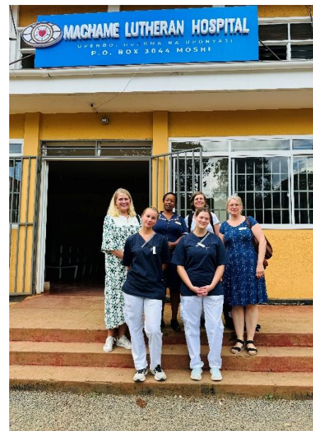
Rektor, studenter på utbyte och medarbetare vid sjukhuset i Machame.