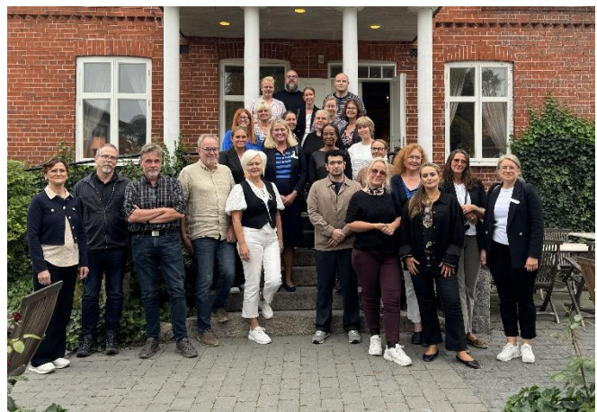
Forskare vid workshop mellan Röda Korsets Högskola och Högskolan Kristianstad

Högskolan har arbetat fram ett inriktningsförslag för att Röda Korsets Högskola inom tio år ska få examensrätt för utbildning på forskarnivå. Högskolestyrelsen har därefter fattat beslut om inriktningen som består av en plan i tre steg.