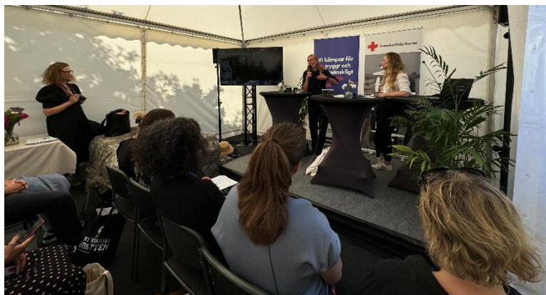
Samordnaren för Röda Korsets kompetenscenter för tortyr- och krigsskaderehabilitering vid ett seminarium i Almedalen i juni.

Kompetenscentrets samordnare har under året skrivit krönikor i Dagens Nyheter för att lyfta frågor rörande flyktingars hälsa och vård. Sammanlagt har 21 krönikor publicerats 2023–2024.